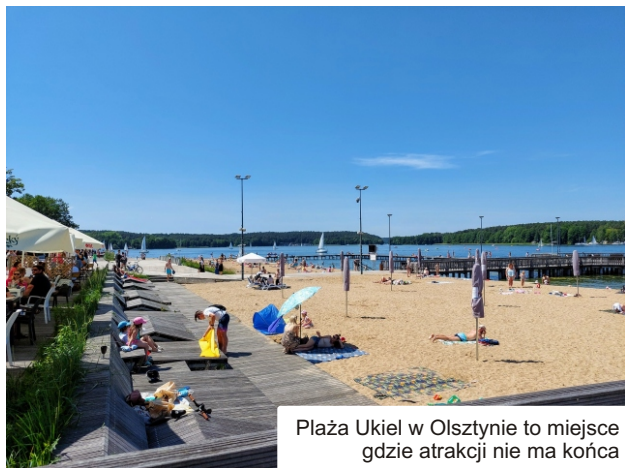
Plaża Ukiel w Olsztynie to miejsce gdzie atrakcji nie ma końca