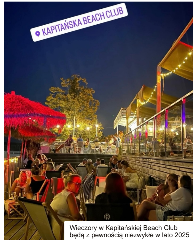
Wieczory w Kapitańskiej Beach Club będą z pewnością niezwykle w lato 2025