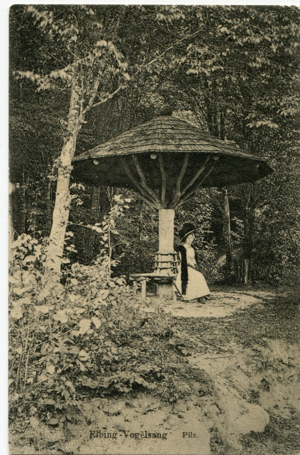
Elbing - Vogelsang Pils.

wykupiła posiadłość wraz z parkiem. Urządzono tu siedzibę miejskiego nadleśniczego. W 1913 roku pałac i cały park włączono w granice administracyjne Elbląga. Teren urozmaicono elementami małej architektury nadając tym samym Bażantarni charakter podmiejskiego parku leśnego dostępnego dla wszystkich mieszkańców.