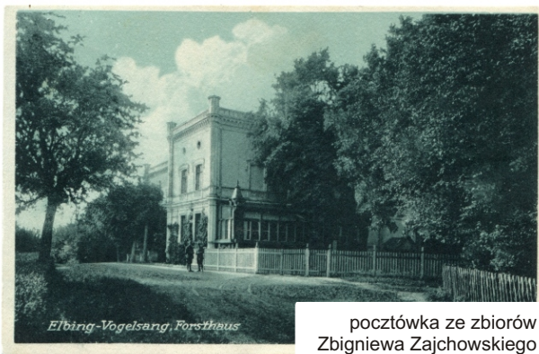
pocztówka ze zbiorów Zbigniewa Zajchowskiego

Pierwsze wzmianki o Bażantarni pochodzą już z 1273 roku. Wówczas na tym terenie funkcjonowało gospodarstwo krzyżackie. W XV wieku dookoła Bażantarni powstawały pierwsze majątki, lecz z powodu ich rabunkowej gospodarki Rada Miejska wydała edykt chroniący ten teren przed wycinką. W XVII wieku piękno tego miejsca odkryli kupcy angielscy, którzy chcieli ulokować tu swoją faktorię, jednakże Rada Miejska nie wyraziła zgody, a kupcy przenieśli się do Łęczna. Ponowna próba zagospodarowania Bażantarni miała miejsce w 1700 roku, kiedy to Rada Miejska zmieniła zdanie i zgodziła się na wydzielenie niewielkiego majątku. Majątek na przestrzeni lat miał wielu właścicieli, którzy wytyczali pierwsze ścieżki spacerowe i próbowali zachęcić ówczesnych elblążan do wypoczynku w tym miejscu. Jednakże warto pamiętać, że wówczas w Elblągu istniały jeszcze mury miejskie, które stanowiły barierę materialną i psychologiczną, elblążanie chętniej wybierali bezpieczne parki miejskie.