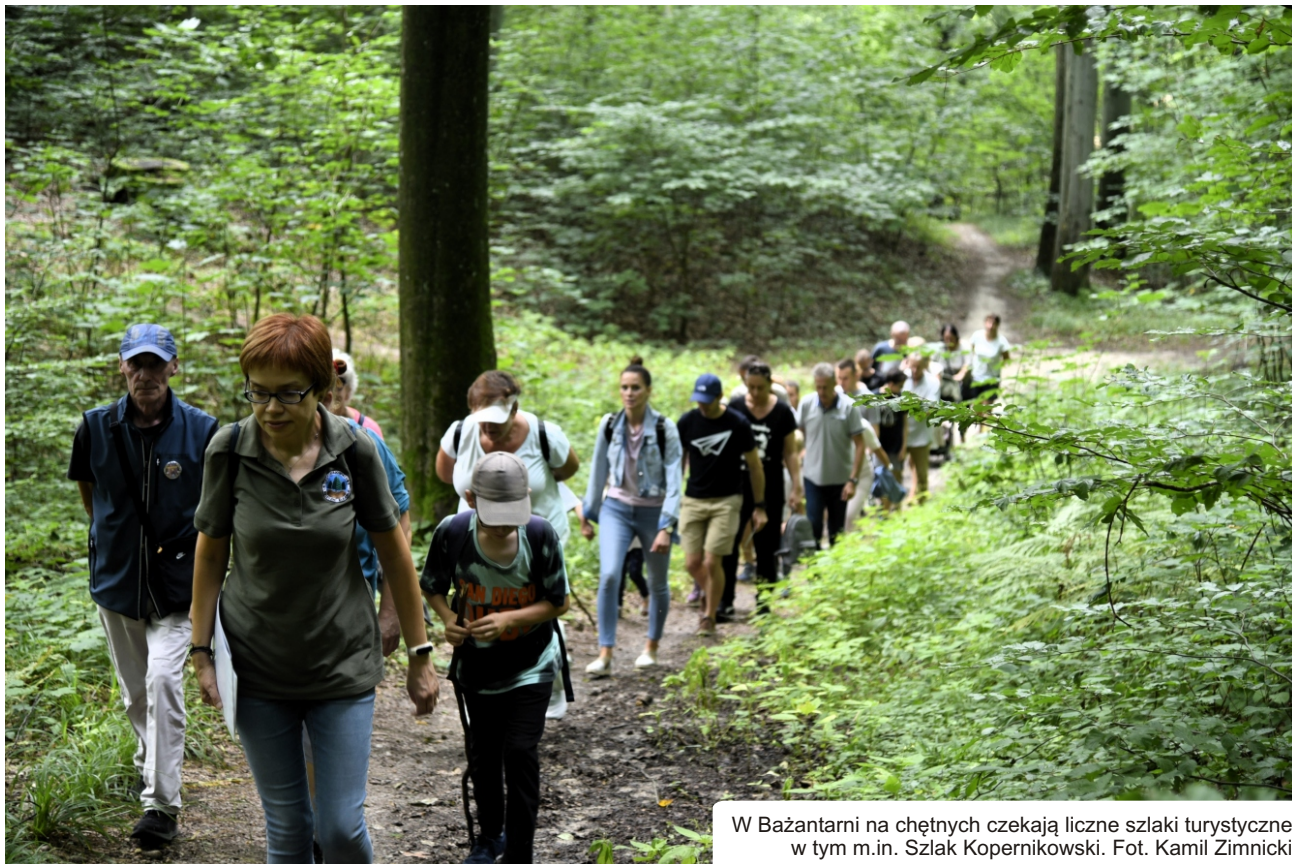
W Bażantarni na chętnych czekają liczne szlaki turystyczne w tym m.in. Szlak Kopernikowski.

Wszystko zmieniło się w 1773 roku, kiedy to rozpoczęły się rozbiórki murów i fortyfikacji miejskich. Mieszkańcy zaczęli na nowo odkrywać okolice. Ówczesny Elbląg był coraz