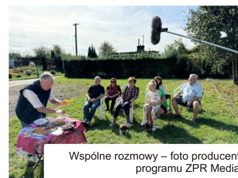
Wspólne rozmowy