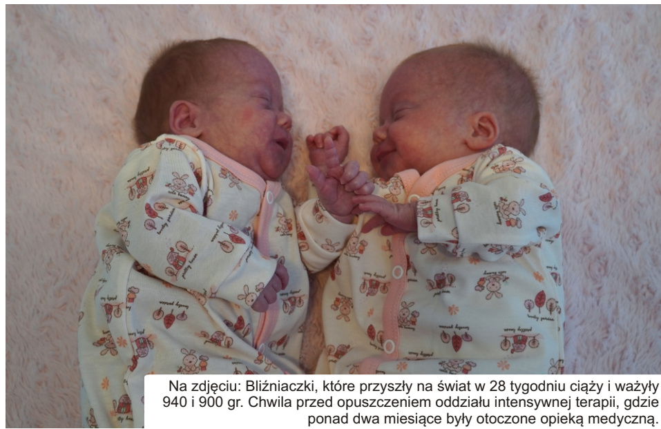
Na zdjęciu: Bliźniaczki, które przyszły na świat w 28 tygodniu ciąży i ważyły 940 i 900 gr. Chwila przed opuszczeniem oddziału intensywnej terapii, gdzie ponad dwa miesiące były otoczone opieką medyczną.

Referencyjność szpitala zależy od poziomu wyspecjalizowania placówki. W polskiej ochronie zdrowia wyróżnia się trzy poziomy referencyjności, przy czym III poziom jest najwyższy. Taki poziom referencyjności ma Wojewódzki Szpital Zespolony w Elblągu. Im lepiej wyposażony szpital i bardziej wyspecjalizowany zespół, tym wyższy ma poziom