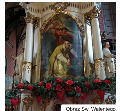
Obraz Św. Walentego

Chełmno to miasto, które z pewnością zachwyci każdego, kto ceni sobie historię, architekturę i piękno przyrody i ... MIŁOŚĆ . Kochani musicie odwiedzić to miejsce, i albo odnaleźć tu miłość swojego życia lub też na nowo rozgrzać ogień w swoim związku... Zapraszamy!