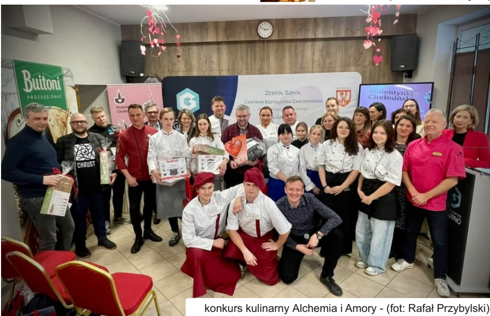
konkurs kulinarny Alchemia i Amory