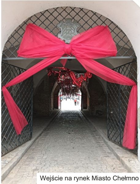
Wejście na rynek Miasto Chełmno

W Chełmnie znajduje się również sześć gotyckich kościołów, zespół klasztorny oraz najstarszy park miejski w Polsce - Planty. To idealne miejsce na spacer i podziwianie piękna natury oraz architektury.