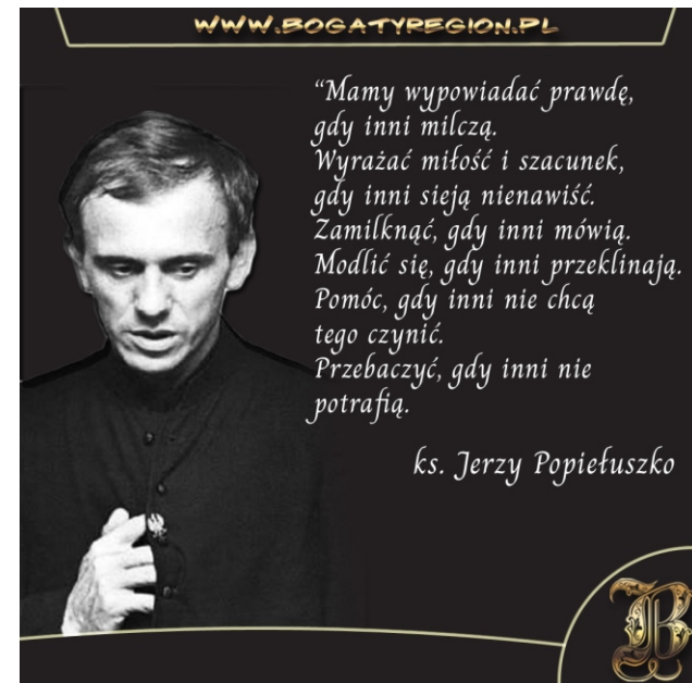
ks. Jerzy Popiełuszko