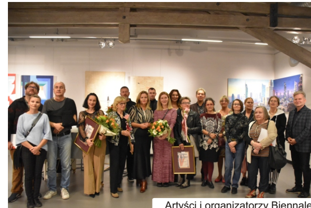
Artyści i organizatorzy Biennale