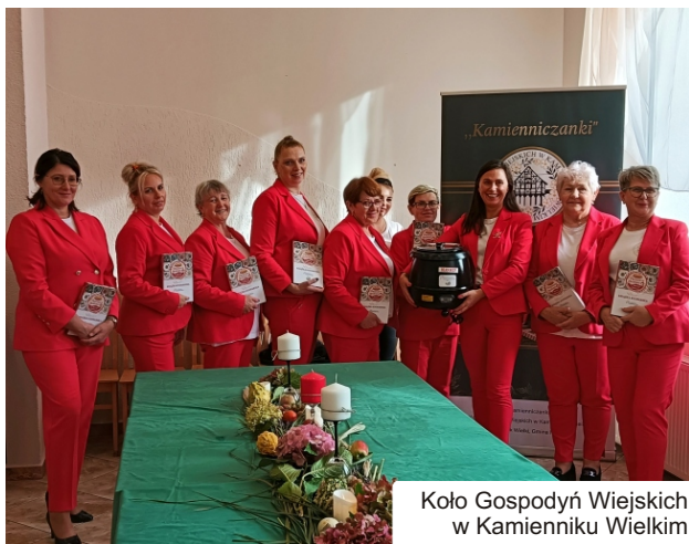
Koło Gospodyń Wiejskich w Kamienniku Wielkim