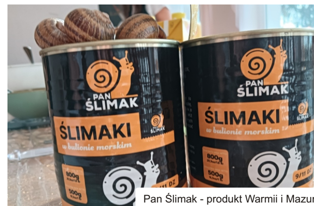
Pan Ślimak - produkt Warmii i Mazur

Jako Redakcja Gazety Bogaty Region dziękujemy, że mogliśmy być z Wami i mamy wrażenie, że to dopiero początek... Z optymizmem czekamy na kolejne wspólne chwile.