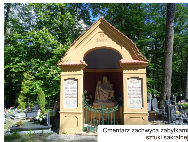
Cmentarz zachwyca zabytkami sztuki sakralnej

Uruchomienie nowoczesnego systemu zarządzania cmentarzami to krok w przyszłość dla Lidzbarka