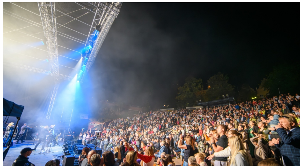
Centrum Edukacji i Inicjatyw Kulturalnych w mijającym roku zorganizowało szereg koncertów i wydarzeń kulturalnych. Przyszły rok również będzie obfity w wiele inicjatyw

- Chcemy, by to był czas świętowania i uhonorowania najważniejszych postaci „Spotkań”, które przez dekady budowały prestiż oraz rozpoznawalność tego wydarzenia. Niebawem będziemy dopra-