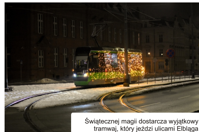
Świątecznej magii dostarcza wyjątkowy tramwaj, który jeździ ulicami Elbląga

Od Świątecznych Spotkań Elblązan na ulicach Elbląga widać pięknie oświetlony świąteczny tramwaj... Od 10 grudnia kursuje on aż do Wigilii na linii nr 4. To nowość w Elblągu, która budzi radość każdego dnia i dodaje uroku świątecznego na ulicach naszego miasta. Pomysł ten bardzo podoba się najmłodszym, które namawiają swoich rodziców by wybierali poruszanie się po mieście tramwajem, a nie samochodem.