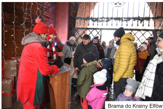
Brama do Krainy Elfów

Wiele lat czekaliśmy za piękną białą pogodą podczas Świątecznych Spotkań Elblązan. W tym roku śnieg nie zawiódł dzięki czemu tegoroczne wydarzenie nabrało świątecznej magii. Na elbląską starówkę przybyły tłumy mieszkańców i gości odwiedzających Elbląg. Każdy z nas mógł skorzystać z tradycyjnych stoisk świątecznych podczas jarmarku. Sporą atrakcją dla najmłodszych była Brama do Krainy Elfów.